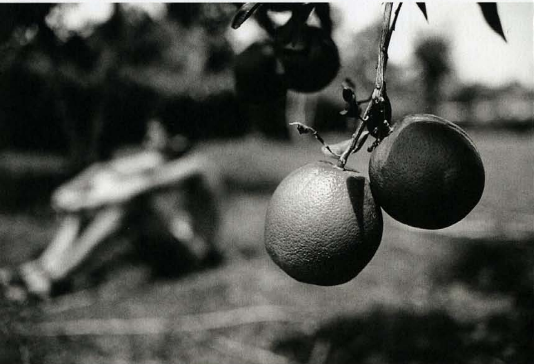
Two Oranges, Dominican Republic, c./um 1997 (Zwei Orangen)

«In der Stille des Nachmittags» beschreibt eine ganz eigene Zeit, Nachmittags um drei Uhr, zwischen Morgen und Abend gelegen, ein Zeitraum entspannter Atmosphäre. Der Ausstellungstitel benennt das Einhalten, Herausheben, die Stille während dieser Stunden, und lässt anklingen, dass das Verlangsamten einen wesentlichen Bestandteil des Lebens darstellt. Das Beschreibende wandelt sich dabei in eine Metapher, der Zeitraum wird zum Kern des Lebens: Es geht um aufgehobene Zeit.