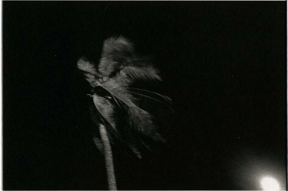
Palm Tree, Cap-Haitien, Haiti, 2003 (Palme)