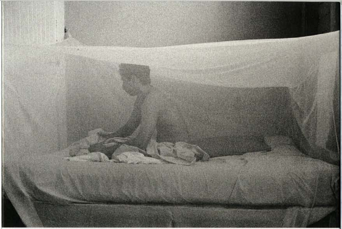
Domingo, Dominican Republic, 1996